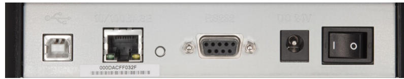
Interfaces LAN, USB y serie incorporadas.